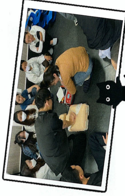
AEDの使い方。心肺蘇生のやり方を教えていただきました。