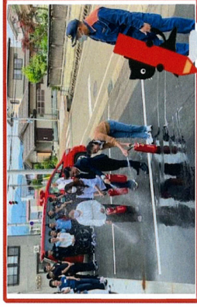
消火器の使い方。みんなで順番に教えていただきました。

警察署の方に日本の交通ルール・自転車の乗り方。日常のとっさの手当や予防に役立つ知識、自分自身の身を守ること。消火器の使い方、心肺蘇生、AEDの使い方を学びました